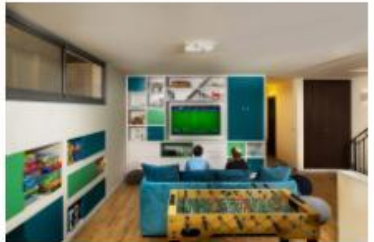
עיצוב: אריאל גורן | אריאל גורן אדריכלות

המחקר מנסה להבין את העולם הילדים ואשר המבנה והסביבה של הילדים היא לא רק חומרית אלא גם רגשית. המחקר מנסה להבין את העולם הילדים ואשר המבנה והסביבה של הילדים היא לא רק חומרית אלא גם רגשית.