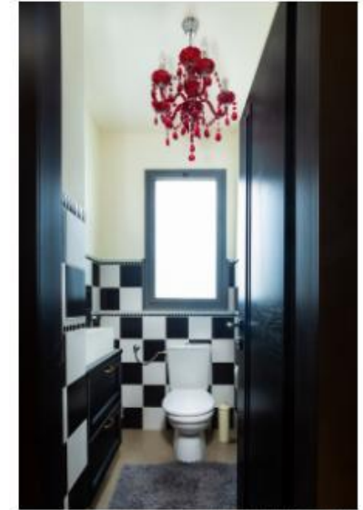
התמונה מוצגת לצורכי הדמיון בלבד. אין להעתיק או לשכפל.

התמונה מוצגת לצורכי הדמיון בלבד. אין להעתיק או לשכפל. תמונה זו היא תוצאה של תהליך יצירה אוטומטי של מערכת הבינה המלאכותית של חברתנו. אין זה מתכוון להעביר או להעיד על אמינות או אחריות כלשהי על ידינו או על ידי מי שיש לו קשר עםנו. אין זה מתכוון להעביר או להעיד על אמינות או אחריות כלשהי על ידינו או על ידי מי שיש לו קשר עםנו.