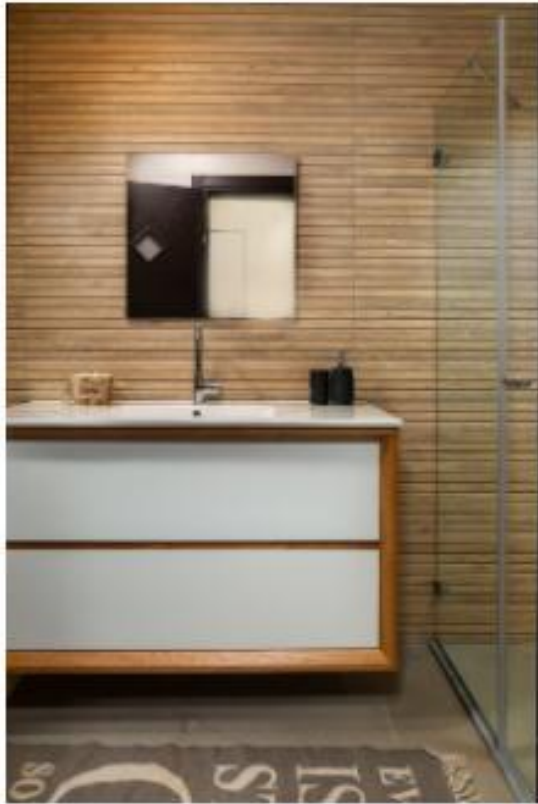
התמונה מוצגת לצורכי הדמיון בלבד. אין להעתיק או לשכפל.

התמונה מוצגת לצורכי הדמיון בלבד. אין להעתיק או לשכפל. תמונה זו היא תוצאה של תהליך יצירה אוטומטי של מערכת הבינה המלאכותית של חברתנו. אין זה מתכוון להעביר או להעיד על אמינות או אחריות כלשהי על ידינו או על ידי מי שיש לו קשר עםנו. אין זה מתכוון להעביר או להעיד על אמינות או אחריות כלשהי על ידינו או על ידי מי שיש לו קשר עםנו.