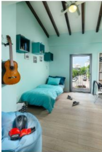
הצילום: אריאל גורן | עיצוב: אריאל גורן | אריאל גורן אדריכלות

בחדר הילדים נוצר דיוקן חמים ומשקף את חיי הילדים והמשפחה. כל פרט נבחר בקפדנות ומשקף את הילדים והמשפחה. כל פרט נבחר בקפדנות ומשקף את הילדים והמשפחה. כל פרט נבחר בקפדנות ומשקף את הילדים והמשפחה.