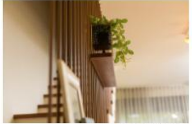
עיצוב: אריאל גורן | אריאל גורן אדריכלות