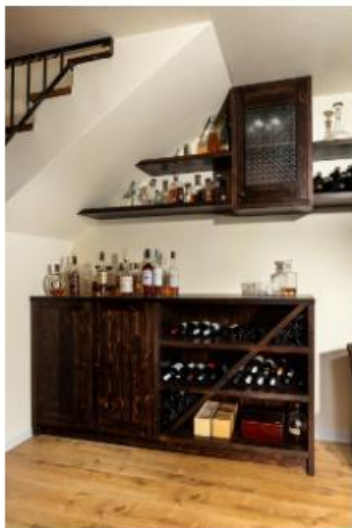
עיצוב: אריאל גורן | אריאל גורן אדריכלות