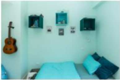
עיצוב: אריאל גורן | אריאל גורן אדריכלות