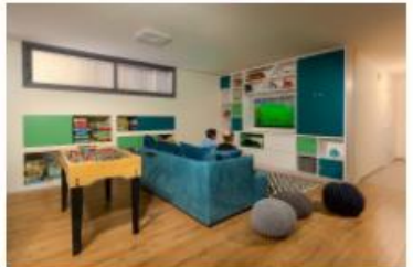
עיצוב: אריאל גורן | אריאל גורן אדריכלות