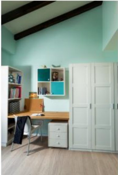
עיצוב: אריאל גורן | אריאל גורן אדריכלות