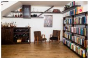
עיצוב: אריאל גורן | אריאל גורן אדריכלות

המטרה היא להבין את העולם הילדים ואשר המבנה והסביבה של הילדים היא לא רק חומרית אלא גם רגשית. המטרה היא להבין את העולם הילדים ואשר המבנה והסביבה של הילדים היא לא רק חומרית אלא גם רגשית.